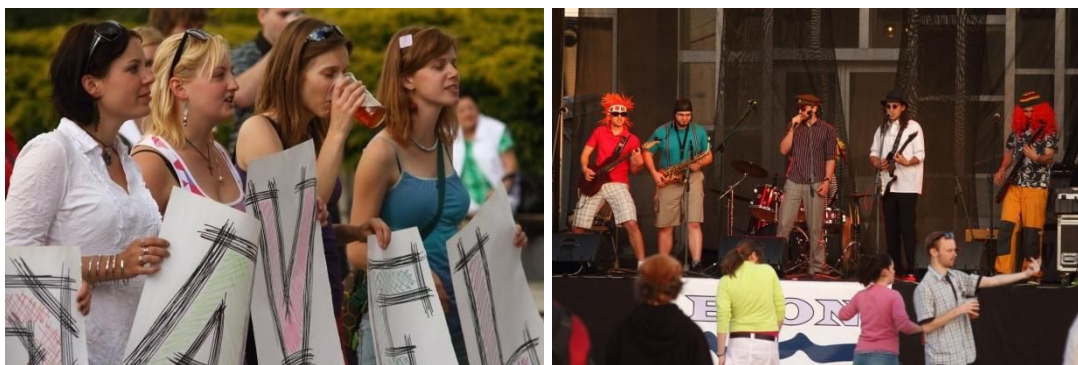
Obrázek 2: Ilustrační foto z Festivalu studentských kapel. (Vlevo: fanyanky, vpravo: vystoupení skupiny Klika)

Při organizaci akce jsme nenarazili na žádné komplikace. Vstup na akci byl bezplatný. Akce se zúčastnily 4 studentské kapely a jeden sólový zpěvák.