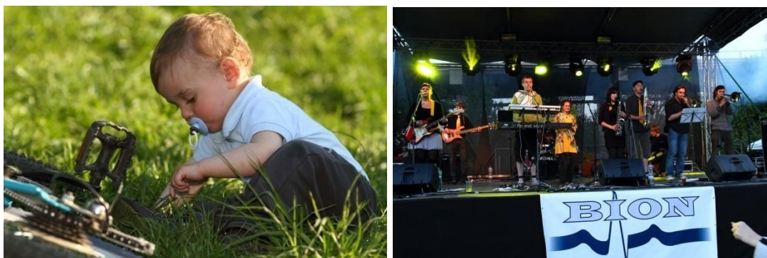
Obrázek 1: Ilustrační foto z Majálesu Kladno 2011. (Vlevo: nejmladší účastník akce, vpravo: vystoupení skupiny Rastafidli Orkestra)